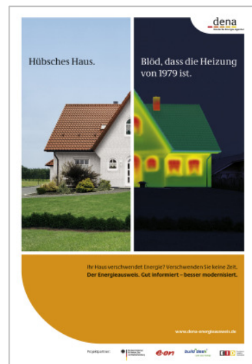
Anzeigenmotiv der PR- und Werbekampagne der dena

Die dena unterstützt die Bundesregierung bei der Umsetzung der EU-Gebäuderichtlinie im Rahmen der Novellierung der Energieeinsparverordnung. Deutschland gehört bzgl. der Umsetzung der EU-Richtlinie zu den führenden Ländern in Europa: Die fachlichen Grundlagen sind vorhanden und seit Jahren erprobt.